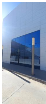
Fachada lateral (callejón)

Nuestra empresa está certificada por la exigente y prestigiosa certificadora (Bureau Veritas), en sistemas de gestión de Calidad y Medio Ambiente según las normas ISO 9001:2015 e ISO 14001:2015.