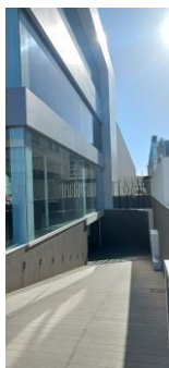
Fachada lateral (entrada parking)