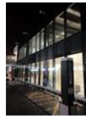
Fachada zona Mcauto

Nuestra empresa está certificada por la exigente y prestigiosa certificadora (Bureau Veritas), en sistemas de gestión de Calidad y Medio Ambiente según las normas ISO 9001:2015 e ISO 14001:2015.