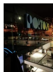
Fachada zona Skalop