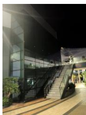
Muro acristalado exterior