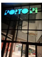
Puerta de acceso

Adjunto le acompañamos presupuesto para la limpieza puntual de cristales y letreros de sus instalaciones sitas en Palma de Mallorca.