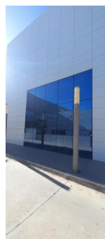
Fachada lateral (callejón)

Nuestra empresa está certificada por la exigente y prestigiosa certificadora (Bureau Veritas), en sistemas de gestión de Calidad y Medio Ambiente según las normas ISO 9001:2015 e ISO 14001:2015.