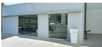
Fachada trasera (patio)

Adjunto le acompañamos presupuesto para la limpieza puntual de cristales de fachada de sus instalaciones sitas en Palma de Mallorca.