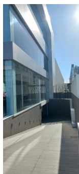
Fachada lateral (entrada parking)